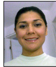
Ejemplo fotografía incorrecta